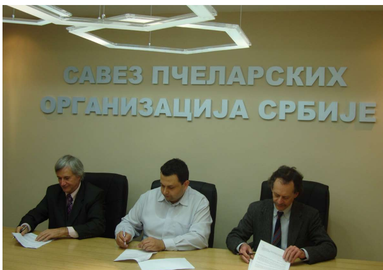
Potpisivanje ugovora Apimondije i Saveza pčelarskih organizacija Srbije o organizovanju Simpozijuma APIECOTECH 2012

Predsednik Saveza pčelarskih organizacija Srbije Predsednik Lokalnog organizacionog komiteta simpozijuma